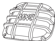
ライトプロテクター (右側)